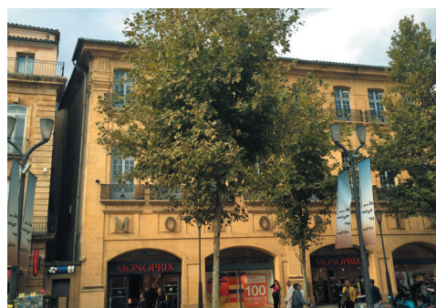
Aix-en-Provence (13) - Cours Mirabeau