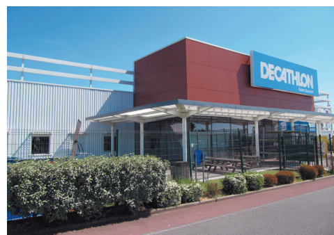
Saint-Quentin (02)